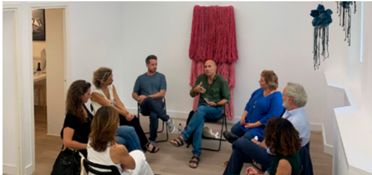
Private is the new public...? a la galeria Zielinsky.